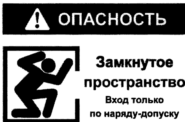
Рекомендуемый знак "ОЗП"

2. Объекты, вошедшие в Перечень 1 и не являющиеся территориально обособленными объектами, должны быть обозначены знаком "ОЗП" (рекомендуемый текст).